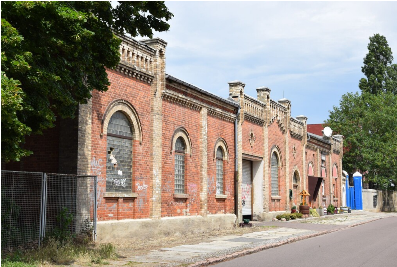
Asphaltwerk und Fabrik für chemische Teerproduktion Hoppe & Roehming - Straßenansicht Hohe Straße ehemalige Produktionshalle