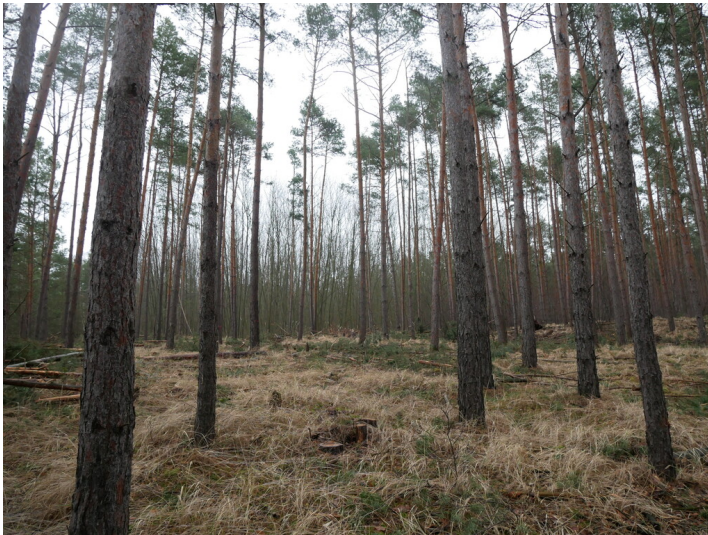
Anwendungsfläche des Domsdorfer Verfahrens