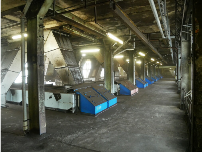
Hammermühlen Nassdienst