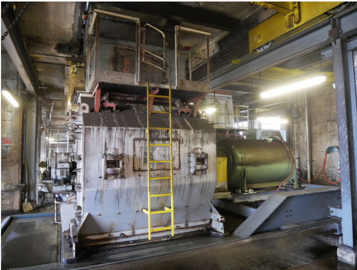
Hammermühlen Vorbrecher