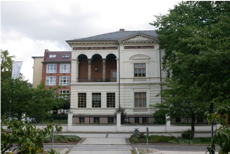
Tuchfabrik F. W. Schmidt