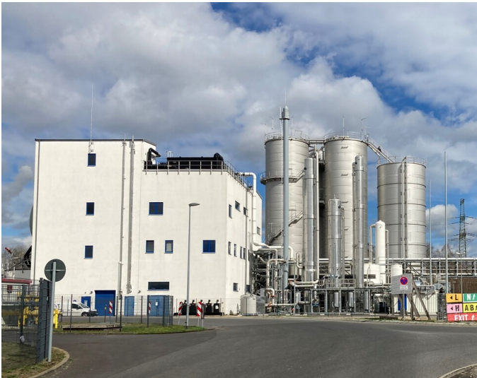
Kohletrübeaufbereitung Brikettfabrik Schwarze Pumpe