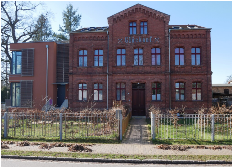
Verwaltungsgebäude Grube Centrum