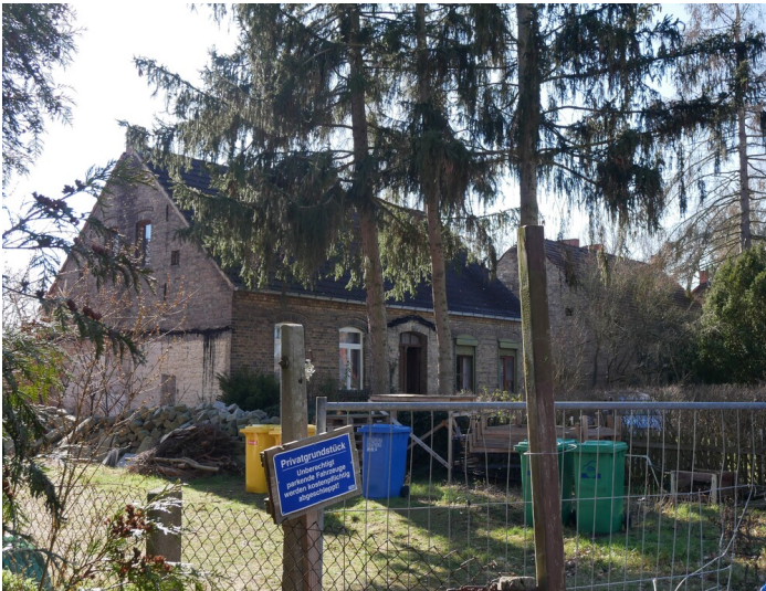
Einzelwohnhäuser Grube Centrum