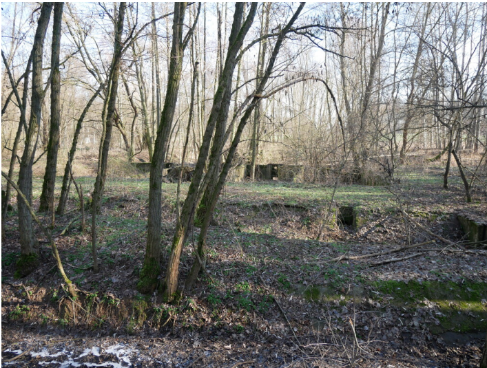
Aufzuchtbecken Fischzucht Kraftwerk Vetschau