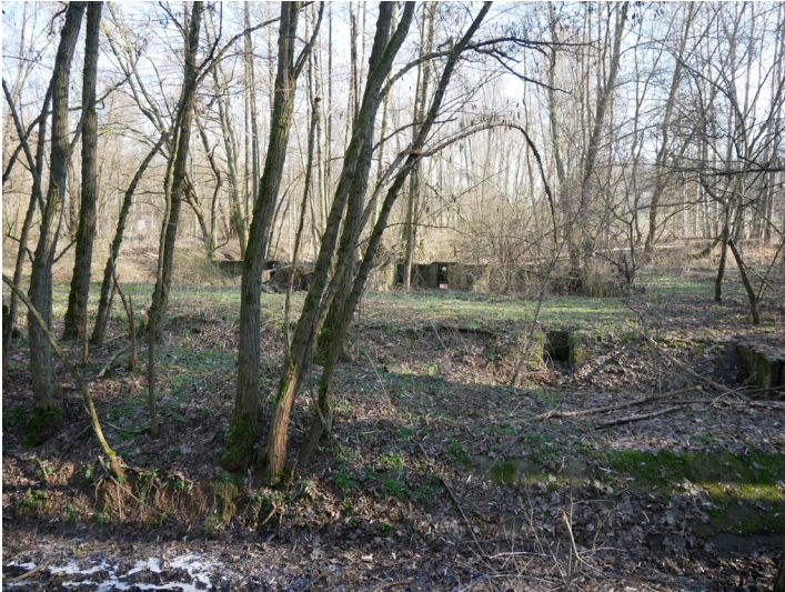
Aufzuchtbecken Fischzucht Kraftwerk Vetschau