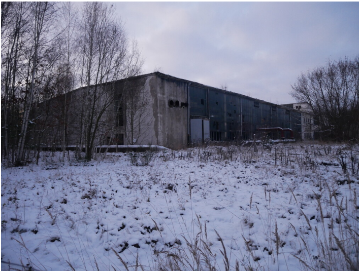
Wasseraufbereitung Kraftwerk Vetschau