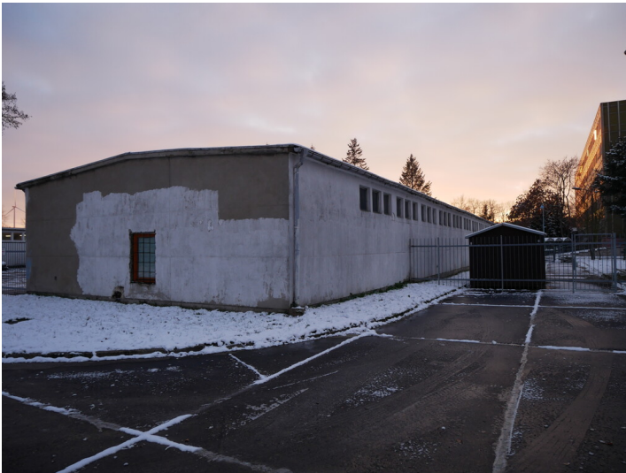
Baracken Kraftwerk Vetschau