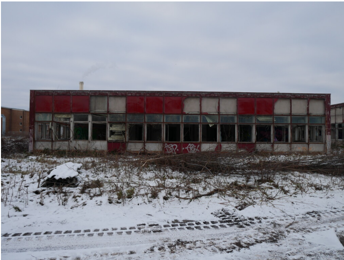
Betriebsgebäude Kraftwerk Lübbenau