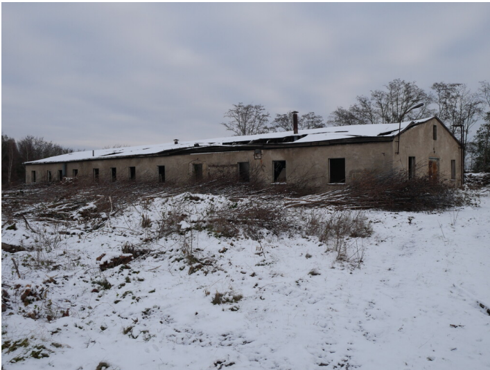
Lagerschuppen Kraftwerk Lübbenau