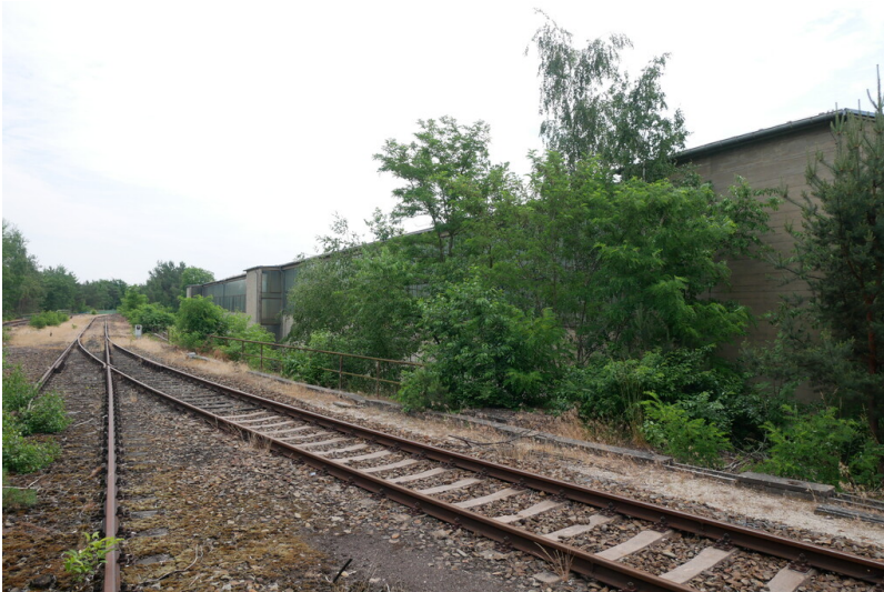
Kohlebunker Kraftwerk Lübbenau