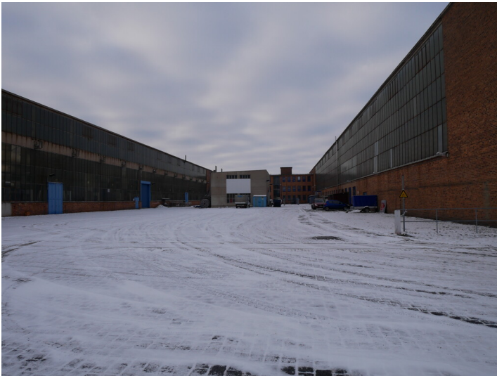
Werkstatt Kraftwerk Lübbenau