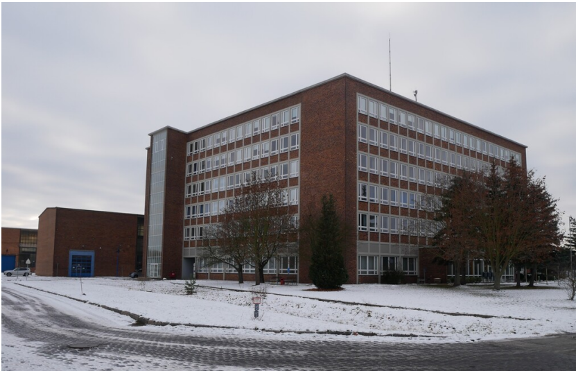
Verwaltungsgebäude Kraftwerk Lübbenau