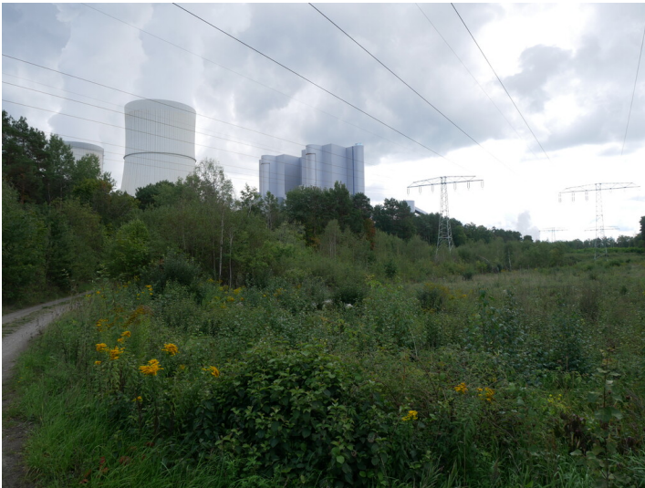
Umspannwerke Schwarze Pumpe

Schlagwörter: Umspannwerk Fachsicht(en): Denkmalpflege Gemeinde(n): Spremberg Kreis(e): Spree-Neiße Bundesland: Brandenburg