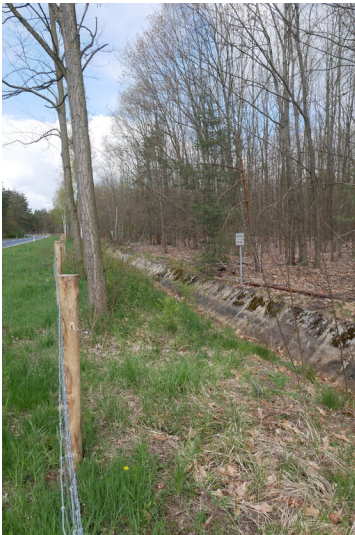
Neues Buchholzer Fließ