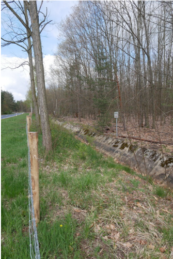
Neues Buchholzer Fließ