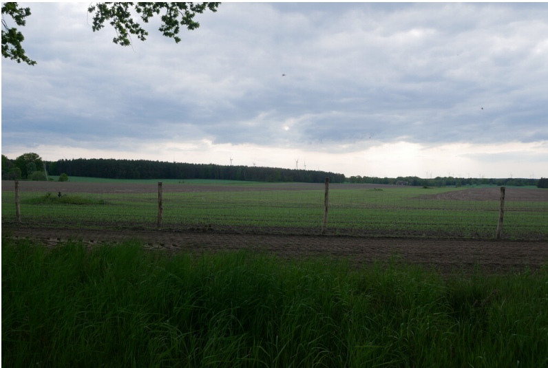
Filterbrunnengalerie Tagebau Greifenhain