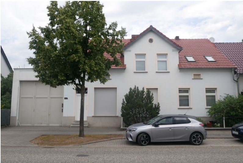
Kohlehandlung Welsch