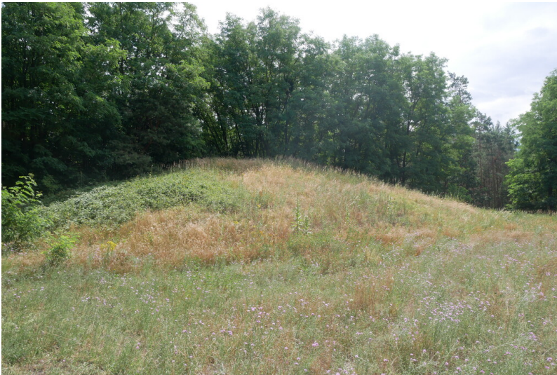
Kohlebahn Tagebau Greifenhain-Brikettfabrik Marie II