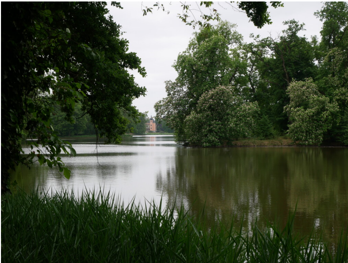
Schloss und Schlosspark Altdöbern