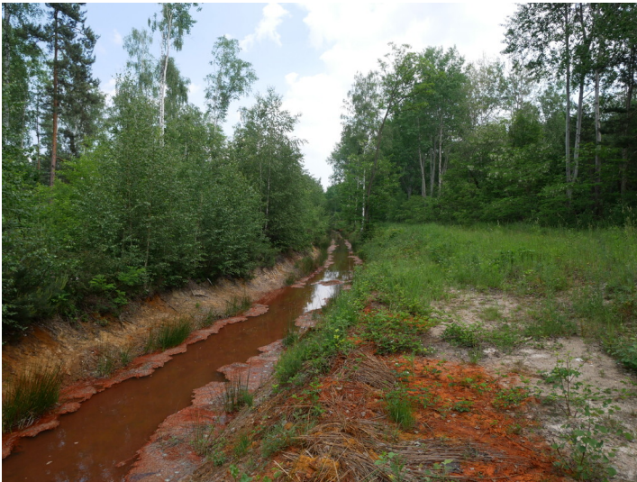
Meuroer Graben