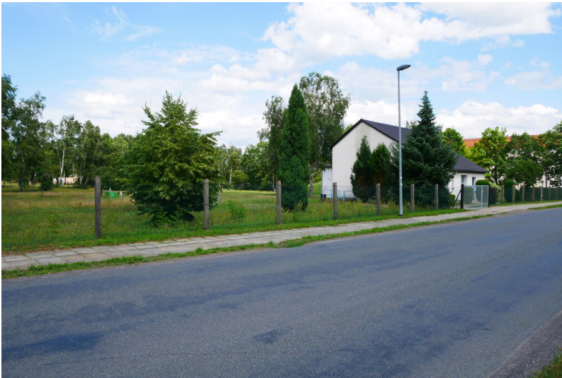
Wasserwerk Altdöbern