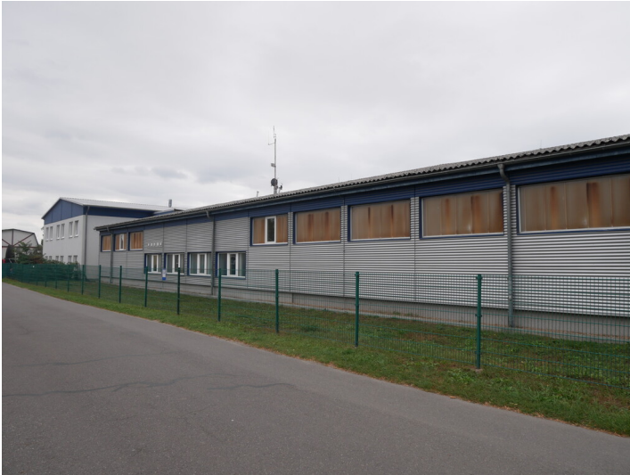
Wasserwerk Lübbenau