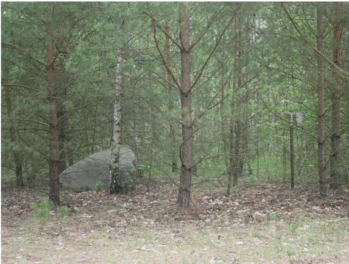
Tagesanlagen Göritz