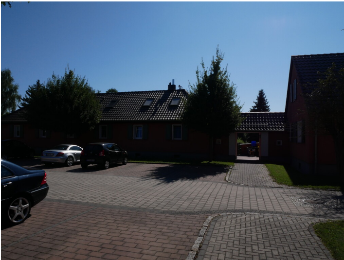
Siedlung Kaupe

Schlagwörter: Reihenhaus Fachsicht(en): Denkmalpflege Gemeinde(n): Spremberg Kreis(e): Spree-Neiße Bundesland: Brandenburg