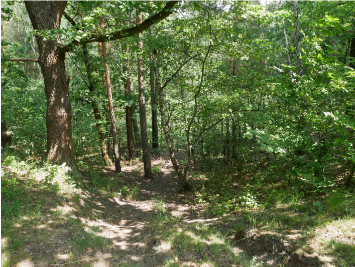
Grubenteich Henriette