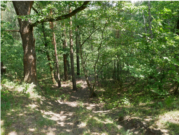
Grubenteich Henriette