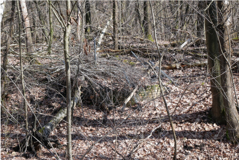
Schacht Grube Henriette