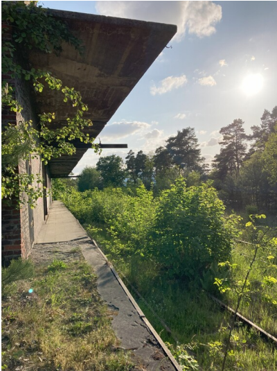
Verladebahnhof ZFE