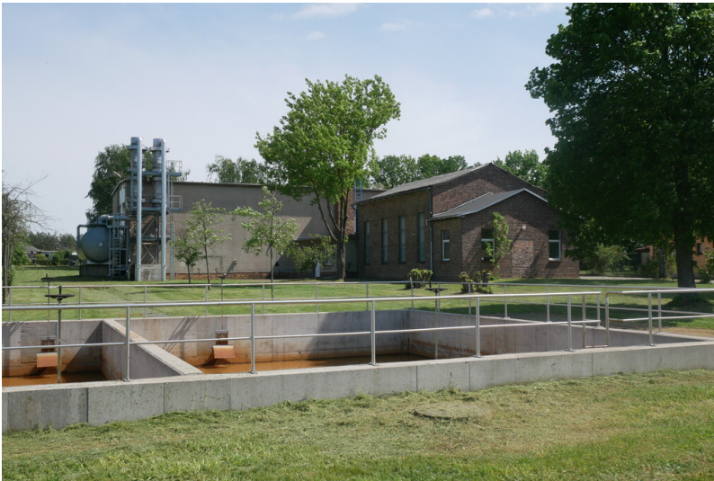
Wasserwerk Vetschau