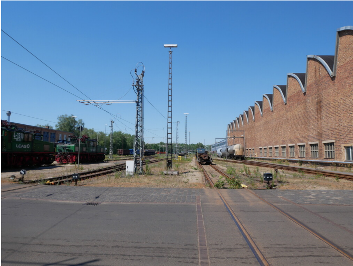
Rangierbereich Hauptwerkstatt