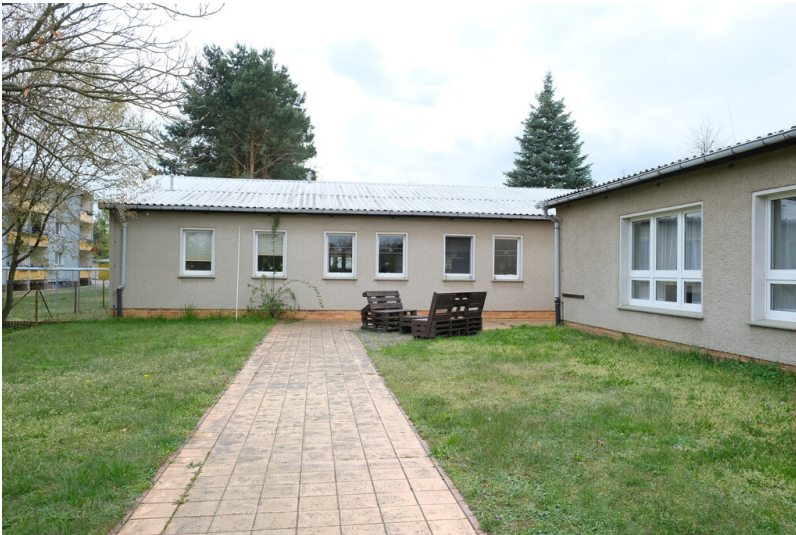
Kindergarten und Hort