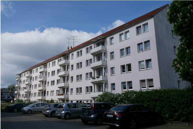
Wohnblöcke der kommunalen Wohnungsverwaltung