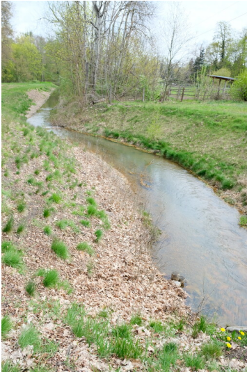
Greifenhainer Fließ