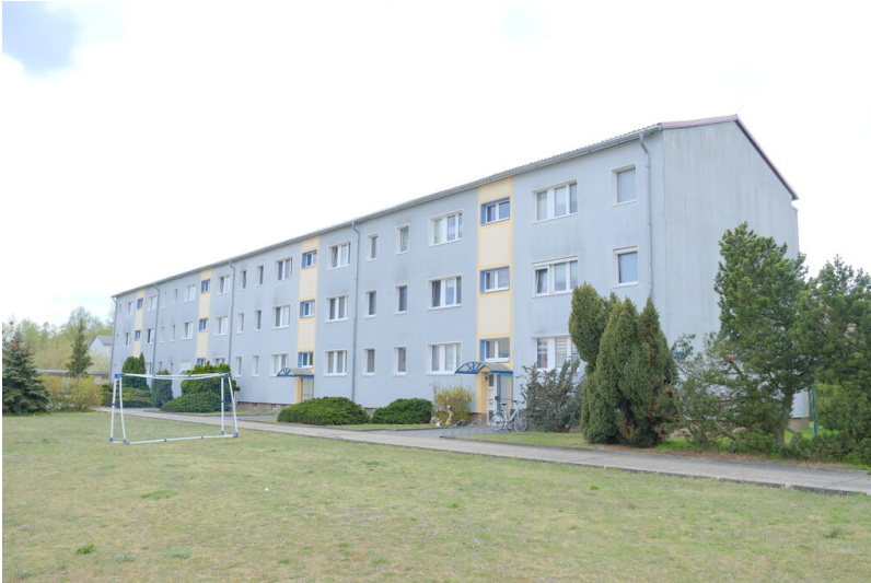
Wohnblöcke der Arbeiterwohnungsbaugenossenschaft Glückauf