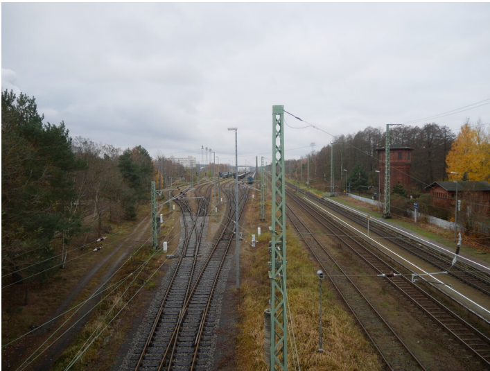
Übergabe Bahnhof Peitz