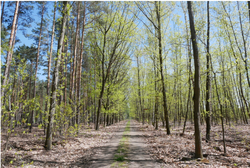
Außenhalde Heye III, Tagebau 1