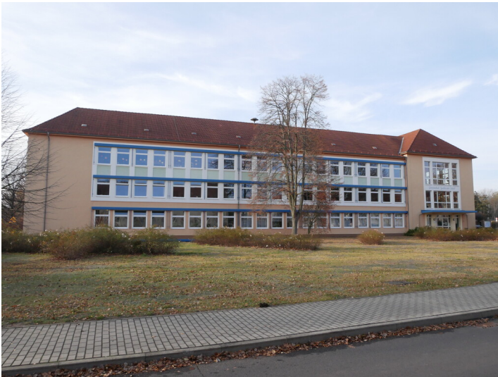
Grundschule Geschwister Scholl