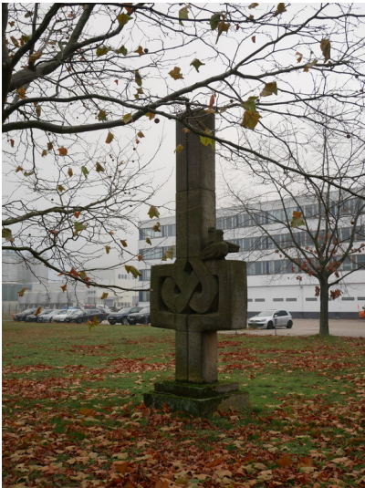
Plastik Gemeinsamer Aufbau Kraftwerk Jänschwalde