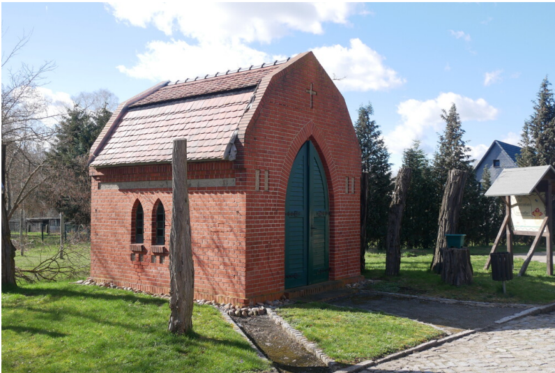
Kapelle Kolonie Grube Henriette