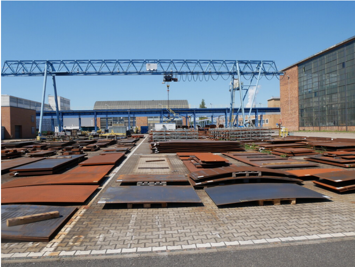
Lagerplatz Metall mit Laufkran