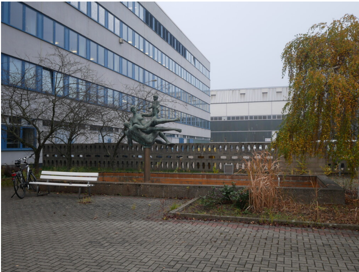
Kraftwerk Jänschwalde Platzanlage (2022)