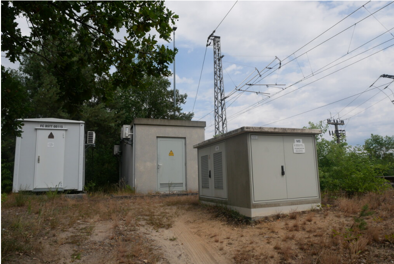
Weiche am Tagebau Welzow-Süd