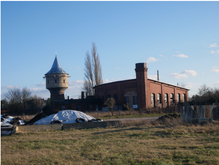
Wasserturm und Ringlokschuppen Bahnhof Finsterwalde