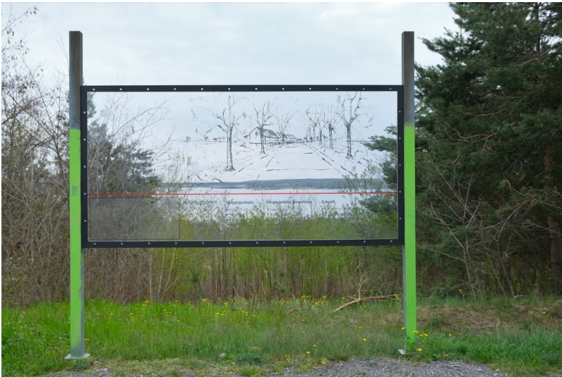
Erinnerungsort Groß Jauer