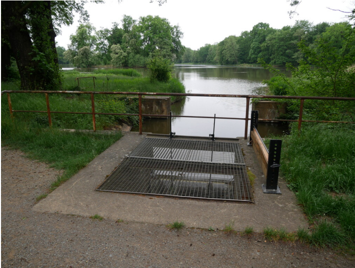
Neues Vetschauer Fließ