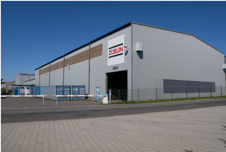
Züblin Stahlbau GmbH