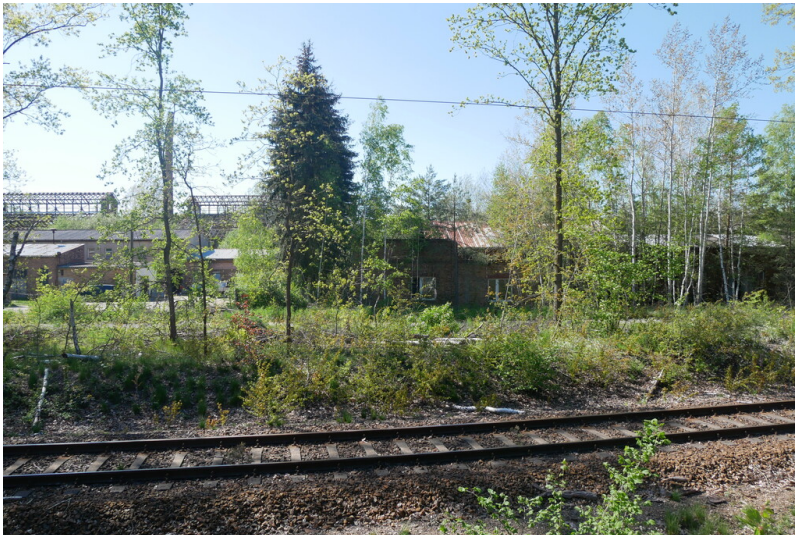
Glaswerk Hosena