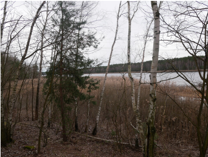
Restloch Heide VI